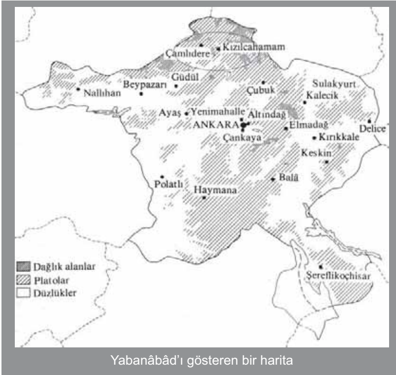
Yabanâbâd'ı gösteren bir harita

Şimdiye kadar Orta Anadolu yöresindeki ilk Kürt yerleşim biriminin varlığı konusunda değişik görüşler öne sürülürdü. Ortaya çıkan yeni belgeler ilk Kürt köylerinden birisinin daha 15. yüzyılda kurulduğunu gösteriyor. 1463 tarihli Ankara Tahrir Defteri adlı kaynakta Ankara'ya bağlı Yabanâbâd (Kızılcahamam - Çamlıdere) yöresinde Kürtler adlı bir Kürt köyünün var olduğu ortaya çıkmaktadır. Orta Anadolu Kürtlerinin tarih yazımında son derece taze bir haber oluşturan bu bilgi, bu yöre Kürtlerinin kronolojisini yeniden kurmamız gereğini ortaya koymaktadır.