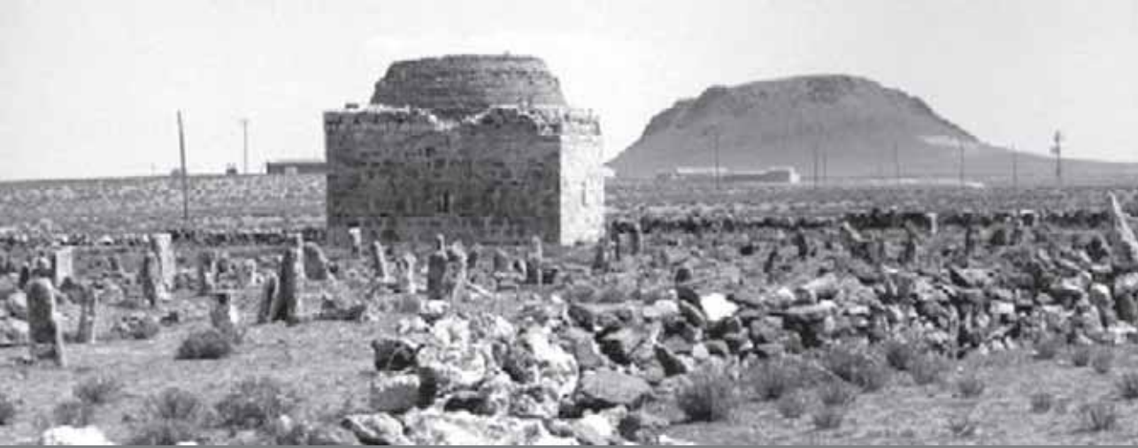
Yapalı Kasabası (Xelikê Jêr)’ndan bir görüntü

adının özdeş olduğu görülüyor. Revanduz Miri olarak da bilinen ve 1830’larda güçlü bir ayaklanmanın başını çekerek, İran ve Osmanlı yönetimlerine kafa tutup bağımsızlığını ilan eden Revanduz’lu