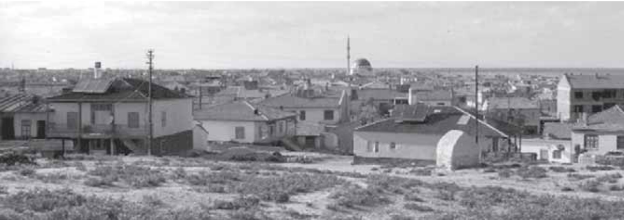
Gölyazı Kasabası (Xelîkê Jêr)'ndan bir görüntü

Halikanların kökenine ilişkin olarak burada bazı kaynaklardan aktardığımız ve Halikanların Revanduz yöresinden geldiği ya da eski uygar kavim Haldilerle bağlantılı