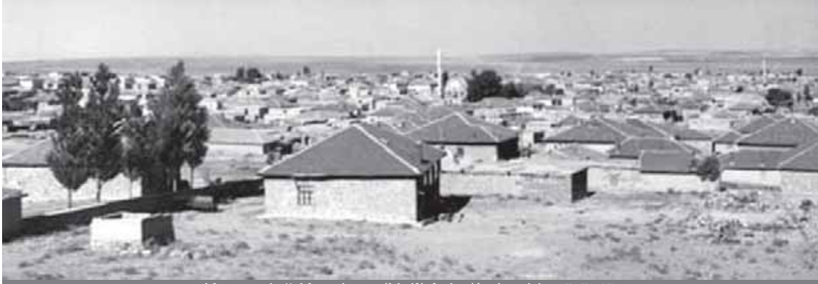
Karacadağ Kasabası (Xelîkê Jor)'ndan bir görüntü

sayı olarak yoğun biçimde vardılar. Zamanla Kürtleştiler. Onlar günümüze dek değişik aşiret ve boyların adlarında yaşayageldiler; Örneğin günümüzdeki Halikanlar, tam da Haldilerin, 2000 yıl öncesine dayanan Grek-Roma kaynaklarına göre, yaşadıkları yerlerde bugünkü ardılları (Halikanlar-YN) yaşıyor. Özellikle Kuzey ve Batı Kürdistan'da...“ (M. İzadi, Kurdische identität- Kurdistan